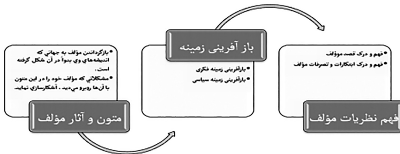
نمودار ۱: مراحل هرمنوتیک اسکینر :

بدین ترتیب چارچوب روش‌شناسی سه مرحله‌ای اسکینر و راهنمای خطوط بنیادینی که برای قابل فهم کردن اندیشه سیاسی مؤلف مورد تأکید قرار می‌دهد (نمودار ۱) بدین شرح است: در مرحله اول، خواننده با متون و آثار مؤلف روبرو می‌شود و به دنبال این است تا با بازگرداندن مؤلف به جهانی که اندیشه‌های وی بدو در آن شکل گرفته است، مشکلاتی که مؤلف خود را در این متون با آن‌ها روبرو می‌دید، آشکارسازی نماید. مرحله دوم، در این راستا پژوهشگر به بازآفرینی محیط تألیف آثار، اعم از بازآفرینی محیط فکری و بازآفرینی محیط سیاسی می‌پردازد. مرحله سوم، در نتیجه محقق به فهم نظریه‌ها و تعالیم مؤلف، یعنی فهم قصد و نیت مؤلف و ابتکارات مؤلف دست می‌یابد. این مراحل در نمودار زیر ترسیم شده است (محمود پناهی، ۱۳۹۴: ۱۷۵).