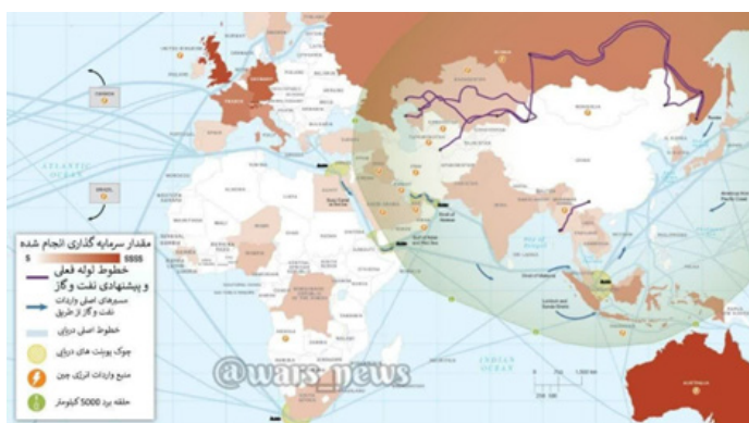
(RAND Corporation, 2022)

شکل (۲): میزان سرمایه‌گذاری چین در کشورهای منطقه خلیج فارس و ایران