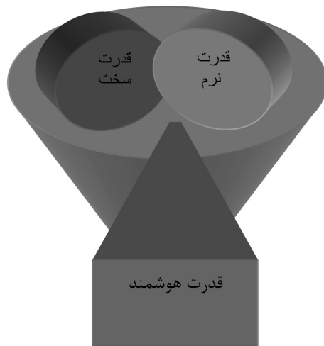
1. the powers of lead

با توجه به آنچه تا کنون بیان شد، مفهوم قدرت تحت تأثیر جهانی شدن سیاست، متحول شده و در ابعاد و معانی متعدد نوینی مطرح شده است. این مساله سبب شده تا سایر مفاهیم مرتبط مانند امنیت نیز تحت تأثیر جهانی شدن به عنوان یک فرآیند عام و همه‌جانبه، با تحول معنایی روبرو شوند. لذا به دلیل وجود دامنه مشترک بین مفهوم امنیت و مفهوم قدرت، بررسی تحول مفهوم امنیت نیز، در این پژوهش ضروری به نظر می‌رسد.