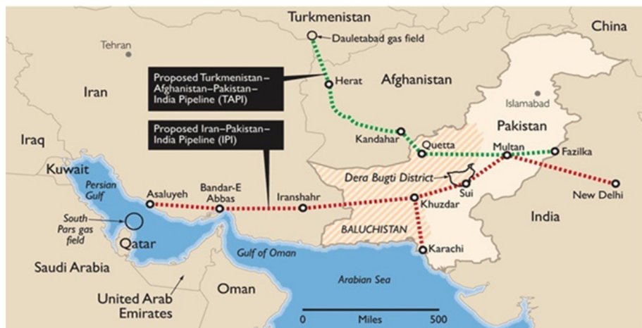
(نقشه ۲) طرح خط لوله صلح و تاپی

این بین ترکمنستان نیز با طرح خط لوله موسوم به «تاپی» (نقشه ۲)، رقیب جدی ایران و خط لوله صلح جهت ترانزیت انرژی به شبه قاره محسوب می‌شود (کولایی و ایمانی کله‌سر، ۱۳۹۵: ۱۳۱). خط لوله صلح علاوه بر این با موانع دیگر از جمله: مخالفت ایالات متحده با طرح مذکور، عدم توافق طرفین بر سر قیمت گاز صادراتی و تنش دیرینه بین هند و پاکستان نیز روبرو است. بنابراین با توجه به موانع موجود بر سر راه طرح خط لوله صلح و نیز تنش‌های موجود و احتمال مسدود شدن تنگه هرمز و وقفه