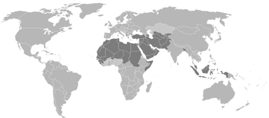
شکل شماره ۱: نقشه کشورهای جهان اسلام، ( http://fa.wikipedia.org/wiki ).

۳. غرب جهان اسلام: شامل کشورهای شمال و شمال شرق و بخش‌های دیگر آفریقا که به عنوان حاشیه مرزی جهان اسلام با اروپای مسیحی محسوب می‌شود و دارای یک فرهنگ آمیخته با کشورهای همجوار اروپایی است. ۴. شرق جهان اسلام: که از مرزهای شرقی ایران آغاز می‌شود و تا کرانه‌های غربی اقیانوس آرام و امتداد دیوار چین گسترش می‌یابد و با حوزه فرهنگی تمدن کنفوسیوس و بودایی هم‌مرز است (بی‌نا، ۱۳۸۹: ۶۰).