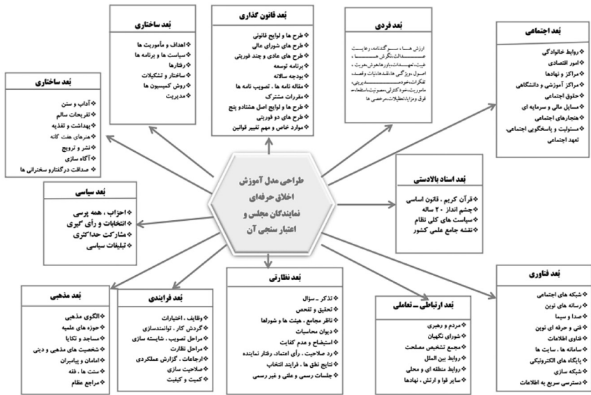
تصویر ۱: مدل مفهومی پژوهش

در حقیقت می‌باید مدلی طراحی شود تا با اجرای آن بتوان مجلس توانمندتری ایجاد کرد و با ارتقای جایگاه سیاسی مجلس، این نهاد حساس، بیش از پیش، سبب کمک به توسعه‌ی پایدار کشور گردد. فلذا با توجه به مبانی نظری و پیشینه تجربی موضوع، مدل مفهومی پژوهش به شکل زیر طرح می‌گردد: