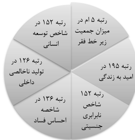
شکل شماره ۱: شاخصه‌های ضعیف اقتصادی و توسعه نیافتگی نیجریه (World Bank, 2015)

بریتانیا، نیجریه به صحنه‌ای برای درگیری‌ها و منازعات مختلف تبدیل شده است. در حوادث سال ۱۹۷۰، جنگ داخلی بر سر استقلال بیافرا بیش از دو میلیون نفر کشته شدند. منابع نفتی توسط دولت‌های فاسد و دزد به غارت رفته و فساد و ناکارآمدی در دولت‌ها فراگیر شده است و نگاهی منفی و بدبینانه شدیدی نسبت به دولت‌ها در بین مردم عادی حاکم است که آتش منازعات و اختلافات را افزایش داده و چالشی برای امنیت نیجریه رقم زده است (Forest, 2012: 21).